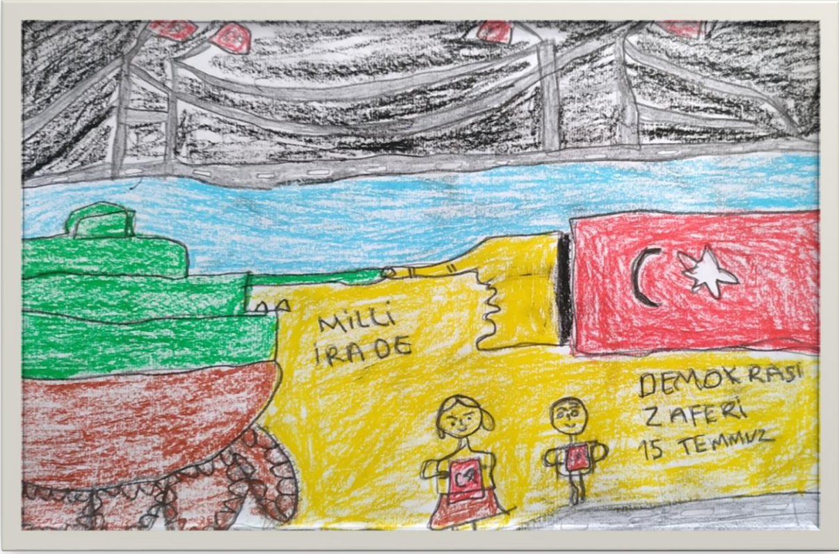
4/A SINIFI YUSUF İSLAM TOPTAŞ