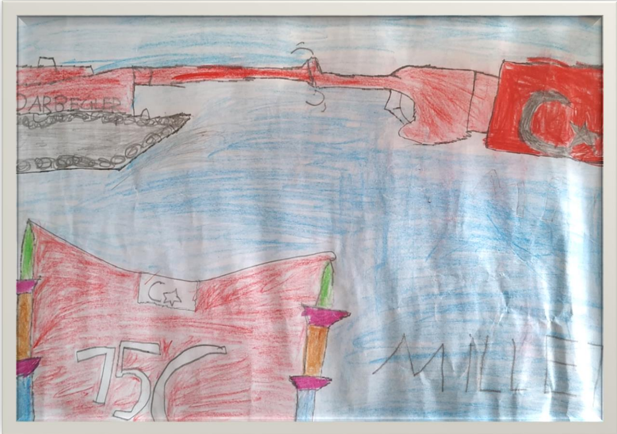
4/A SINIFI MEHMET KAN TOPTAŞ